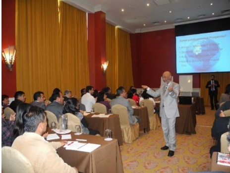
Trénovanie lídrov v Peru

5. BUDOVANIE MÔJHO TÍMU A LÍDROV – ťažko som pracoval, aby som vybudoval správny tím a zopár vybraných lídrov. Budovanie tímu bolo jednoduché, ale budovanie tímlídrov bola mamutia úloha a stále na nej pracujem. Budovanie lídrov je nepretržitý proces a práve tam leží reziduálny príjem.