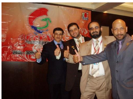
Moja DXN rodina