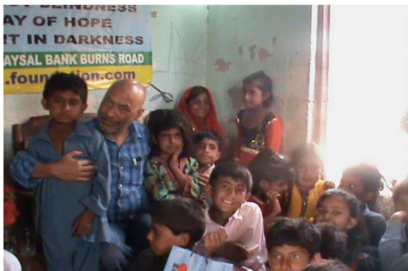
Moja motivácia: Pomôcť deťom